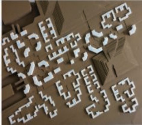
Ada Kenti Tasarımı Bozcaada: 1/1000 Ölçekli Tasarım Çalışmaları

Tasarımın temel kavram ve ilkelerinin tanıtılması, yaratıcı düşünme yeteneğinin ve el becerilerinin geliştirilmesi, farklı araçlarla 2 ve 3 boyutlu kompozisyonlar oluşturma yöntemlerinin deneyimlenmesi