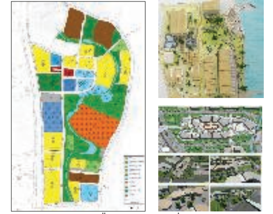
Çanakkale 1/1000 Ölçekli Uygulama İmar Planı ve Kentsel Tasarım Çalışmaları

Farklı ölçeklerdeki kentlerde belirli bir tematik soruna yoğunlaşarak, bütüncül tasarım yaklaşımı ile 1/5000 ve 1/1000 ölçekli imar planlarının geliştirilmesi, 1/1000 ve alt ölçeklerde tasarım detaylarının üretilmesi