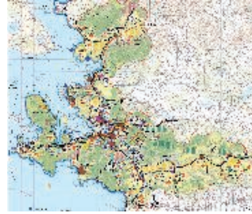
İzmir 1/100.000 Stratejik Bölge Planı

Büyük bir kent-bölge ya da bir metropoliten alanın detaylı bir kent çalışması ile ele alınması, bölgesel analizlere dayalı olarak temel planlama konularının, vizyon, strateji ve politikaların belirlenmesi