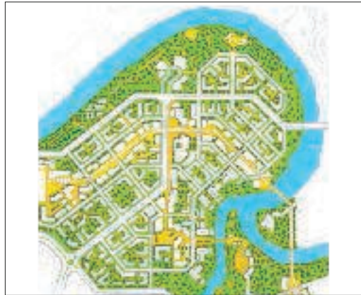
Bartın 1/1000 Ölçekli Kentsel Tasarım Çalışmaları

Kapsamlı planlama yaklaşımının küçük ölçekli bir kent üzerinde bölgeden parçaya doğru değişen ölçeklerde çalışılması, analiz ve kentin gelişim / gelecek sorunsalına yönelik planlama ve tasarım uygulamaları